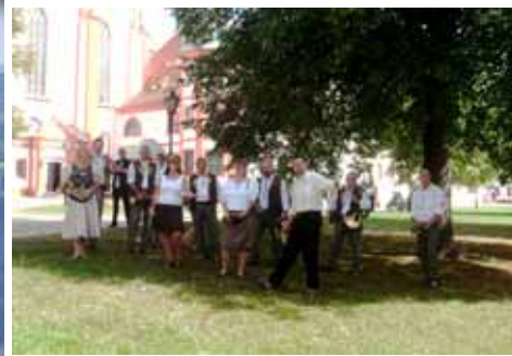
Zwischen Sandstein und Granit