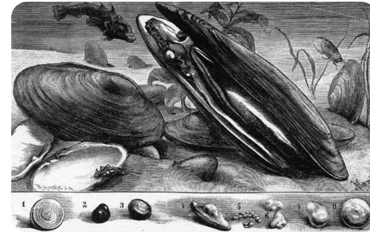
Illustration des Lebenszyklus der Flussperlmuschel aus Brehms Tierleben

Perlen oder Perlentaucher werden viele nicht mit unserer Region, sondern eher mit tropischen Meeren verbinden. Und doch kamen in der Vergangenheit auch in der Sächsischen Schweiz Flussperlmuscheln vor. Sie sind wie ihre tropischen Verwandten in der Lage Perlen zu bilden. In der Mitte des 19. Jahrhunderts wurden sie für die „Polenz bei Schandau“ angegeben.