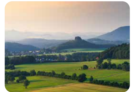
Der unverkennbare Blick vom Wolfsberg nach Böhmen

Im Jahr 2024 wurde der Caspar-David-Friedrich-Weg umfassend überarbeitet. Anlässlich des 250. Geburtstages des Malers erhielt der Wanderweg eine neue Wegführung und -beschilderung sowie aktualisierte Infotafeln. Dieses Vorhaben wurde als gemeinsames Kooperationsprojekt umgesetzt. Die Stadt Bad Schandau, die Gemeinde Reinhardtsdorf-