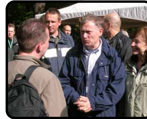
Horst Köhler im Gespräch mit dem damaligen und heutigen Geschäftsführer des Tourismusverbandes Sächsische Schweiz, Tino Richter.

Der ehemalige Bundespräsident Horst Köhler besuchte am 5.10.2007 den Nationalpark Sächsische Schweiz. Damit war er der bislang einzige Bundespräsident, der die sächsischen Nationalparkfelsen offiziell besuchte.