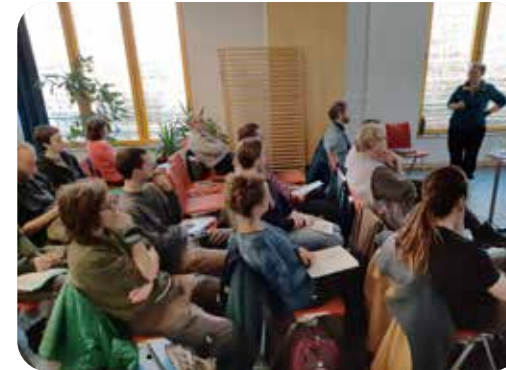
Kurz vor Saisonbeginn fand am 11.2.2025 für rund 20 Teilnehmer die Schulung bzw. Auffrischung für das diesjährige Specht- und Kleineulenmonitoring statt.

Mitarbeiter und Ehrenamtler der Nationalpark- und Forstverwaltung Sächsische Schweiz unterstützen das bundesweit und nach einheitlichen Standards durchgeführte Monitoring seltener Brutvögel des Dachverbands Deutscher Avifaunisten (DDA).