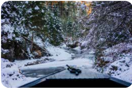
Die Leichtigkeit des Seins: Winteridylle an der Oberen Schleuse.