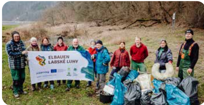
Zum Aktionstag befreiten die Engagierten die Elblache „Biberlöcher“ von viel Müll, der sich hier angesammelt hatte.

Mitte der 1990er Jahre wurde die Elblache „Biberlöcher“ in Prossen durch die Nationalparkverwaltung großflächig ausgebagert und als Biotop erhalten.