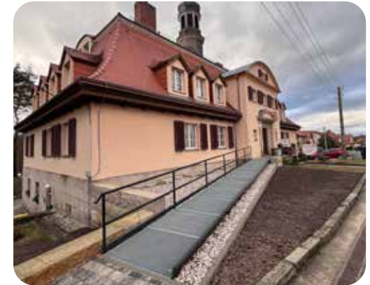
barrierefreier Zugang in die ASB-Sozialstation

Der Zugang wurde mittels einer freischwebenden langlebigen Stahlkonstruktion innerhalb eines halben Jahres realisiert. Diese fügt sich nahtlos ins historische Erscheinungsbild des Gebäudes ein und wurde in der Form auch vom Denkmalschutz anerkannt. Somit kann der etablierte Standort mit pflegerischen, medizinischen und betreuerischen Angeboten für alle aufrecht erhalten werden. Durch den Neubau der Rampe bleibt der ungehinderte Zugang zum Objekt bestehen und das bereits bestehende Dienstleistungsangebot, u. a. ambulante Betreuung von Pflegebedürftigen, Seniorennachmit-