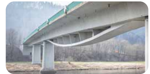
Die Schandauer Elbbrücke ist Sachsens Bauprojekt Nr. 1! Es gibt Grund zur Hoffnung.

auf unsere Gäste! Ohne unsere Brücke sind manche Wege ungewohnt, aber dafür kann man auch „neue Wege“ entdecken. Kurzum, alle Gäste sind herzlich willkommen. Kommen Sie zu uns und lassen Sie sich inspirieren von Sandsteinfelsen, Tafelbergen und Kulinarik.