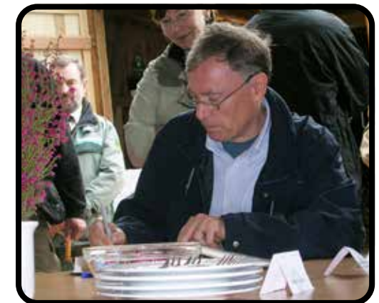
Hier trägt sich Horst Köhler an der Wildwiese in das goldene Buch der Stadt Bad Schandau ein.

Am 01.02.2025 ist Horst Köhler im Alter von 81 Jahren verstorben.